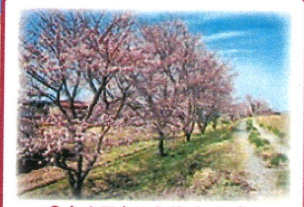
⑩ 久米岡自治会館 (河川敷) 会館裏の河川敷に桜が立ち並びます。