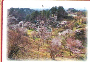
④ 石倉山公園 公園の斜面にはたくさんの桜が並びます。