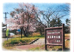
③ 釜谷農村公園 公園を囲むように桜が植えられています。