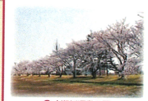
⑪ 小瀬川運動公園 町道沿いに桜が立ち並びます。