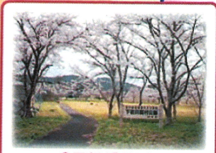
③ 下岩川農村公園 こじんまりとした公園を桜が囲みます。