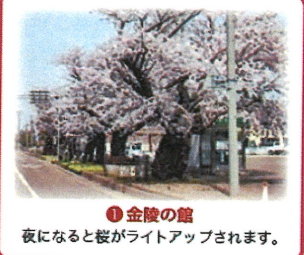
① 金陵の館 夜になると桜がライトアップされます。