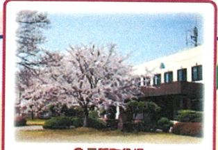
⑧ 三種町役場 来庁した際にご覧ください。