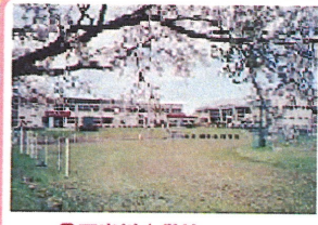
⑥ 下岩川小学校 グラウンド沿いに桜が立ち並びます。