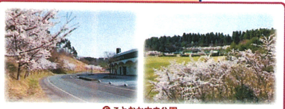
⑤ ことおか中央公園 公園内には、様ざまなところに桜が植えられています。