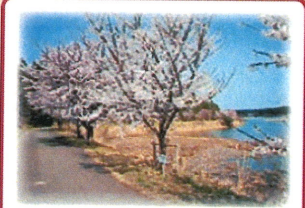
⑨ 角助沼 沼を囲むように、約500本の記念植樹がされています。