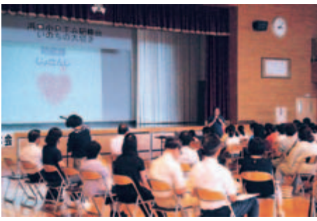
いのちの大切さ講座 (浜口小学校)

講座を受けたみなさんは、自分のいのちの重さを実感し、また、家族への感謝の気持ちを新たに抱いているようでした。この講座は町の地域自殺対策強化事業として行われており、今年度は6校で行われる予定です。