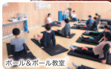
ポール&ボール教室