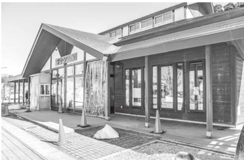
地域への社会貢献に大きく寄与する直売所の支援を

今後ハード、ソフト両面からの可能な支援策を模索する。それに向けて直売所とアポを取った上で経営者側の意見を聞く機会を設けたい。