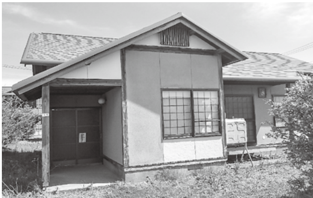
町単独住宅の状況は