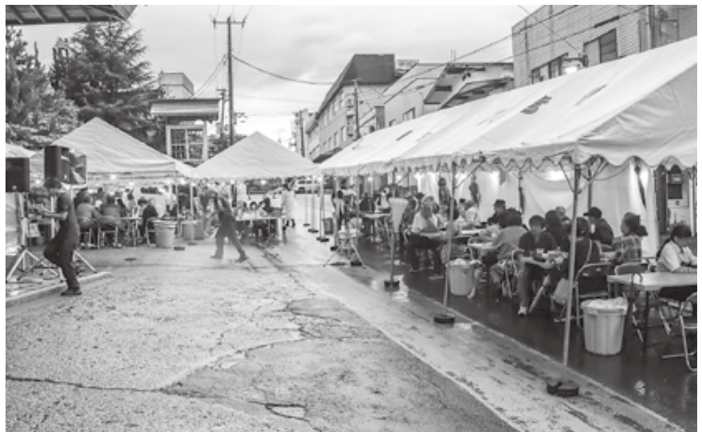
森岳温泉活性化協会が主催するビアガーデン

問 「みらい創造プラン」に森岳温泉の活性化が見えてこない。どのように活性化させるか、その道筋を示されたい。