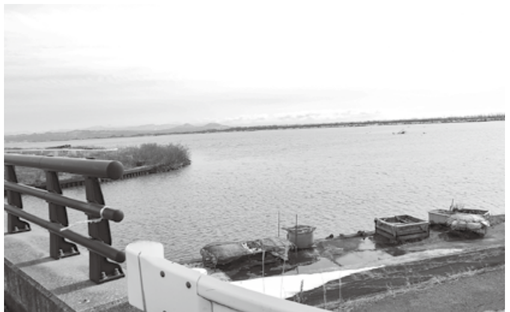
令和7年度に浚渫工事が行われた東部承水路（久米岡付近）