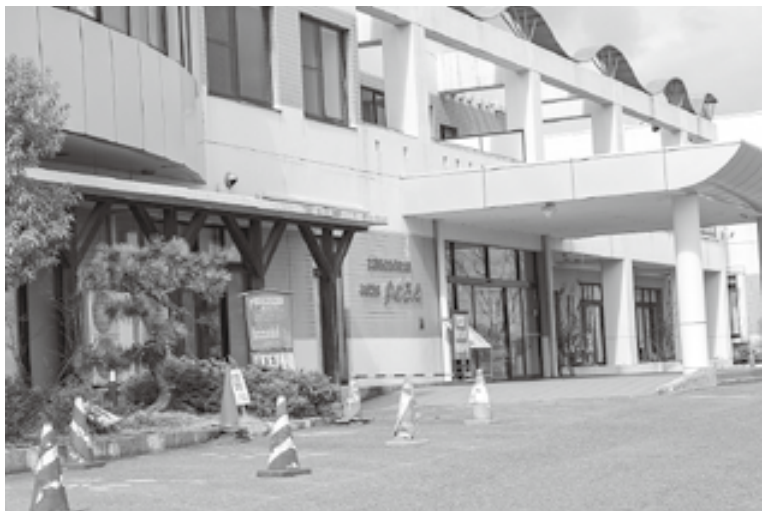
指定管理料が人件費などにより増額

答 管理強化ゾーンとして石倉山公園周辺を設定している。これは全県同様な動きで県より指示があり、町でも実施している。今現在1つの許可で上限6頭まで捕獲できることになっているが、管理強化ゾーン設置により捕獲無制限が可能となる。