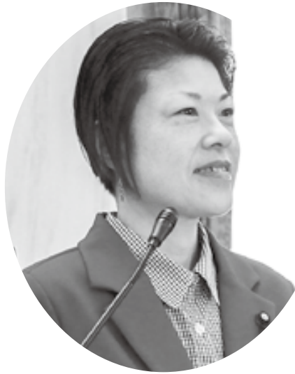
みむら まき 議員 三村 眞

課長等 園長会議への参加は年に数回だが、重要な連絡事項がある場合など必要に応じて参加している。日常的にも、各園と随時連絡を取り、状況把握に努めている。