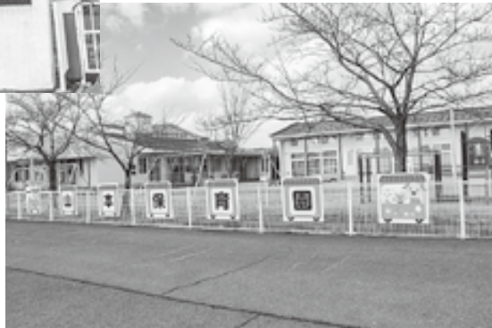
公立保育園運営の継続を