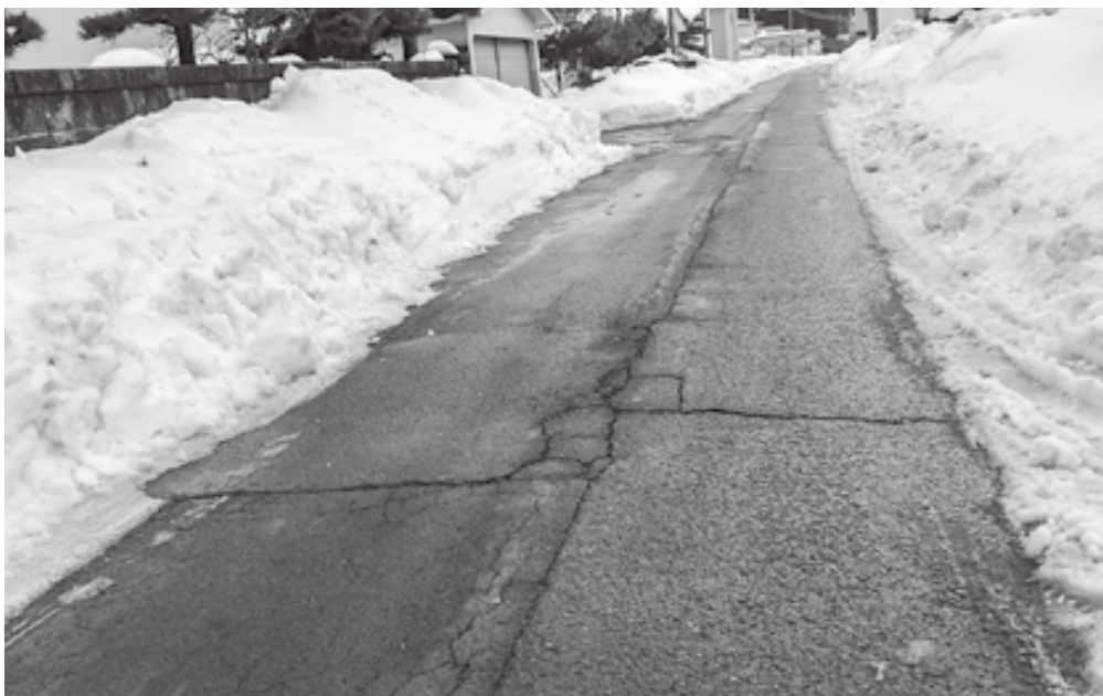
令和8年2月上旬積雪により道幅が狭くなった道路