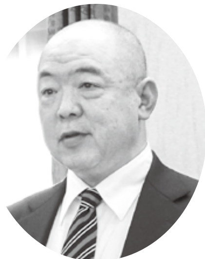
もりやま だいすけ 議員 森山 大輔