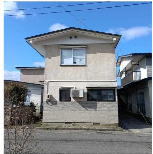
写真 (撮影日: 令和8年4月)