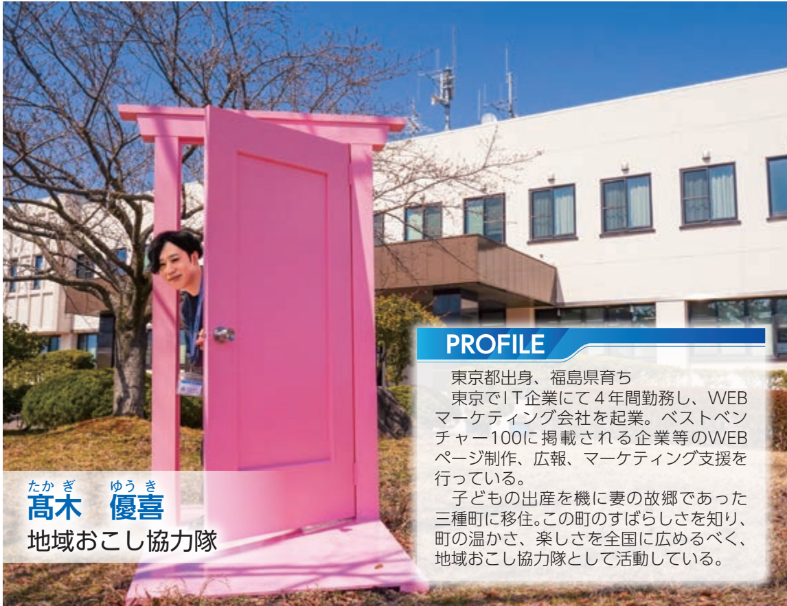
たかぎ ゆうき 高木 優喜 地域おこし協力隊