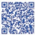
公式Facebook 地域おこし協力隊

前職では広告CMなどを作っていました、「みたねのむすびch」のような動画を作った経験がないので、とても緊張しています。気がなった点や「もつとこうしたほうがいいよ」という点がありましたら遠慮なく教えてください！