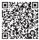
公式YouTube みたねのむすびch