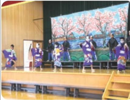
子ども歌舞伎 (森岳小)

チアダンスを披露。縄跳びやフラダンスも上手でした。黄色い麦わら帽子をかぶったのキョーシ風ダンスはとってもかわいかったです。下岩川小学校では全校合唱で「宝島」と「いのちの歌」を披露しました。家族や地域への感謝と元気を届けるため一生懸命練習しました。本番では感情豊かな歌声で参観者に大きな感動を与えることができました。森岳小学校では歌舞伎クラブの皆さんが日頃の練習成果を披露しました。堂々とした迫力ある演技を会場から大きな拍手と声援をいただきました。来年の1月24日には「わらび座(仙北市)」での発表が決まり今後練習に励んでいくそうです。