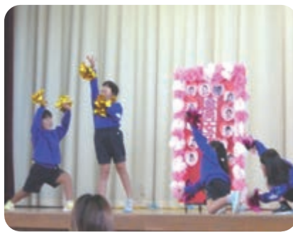
金岡女子〜ズ (金岡小1年生)