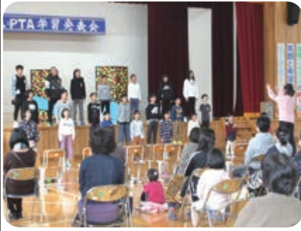
全校合唱 (下岩川小)

先月号に続き小学校の学習発表会での活躍場面を紹介します。金岡小学校1年生は女子12名の学年です。野球の応援コールに合わせて元気よく登場し応援