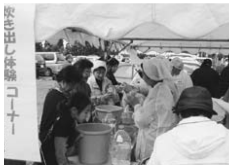
▲赤十字奉仕団による炊き出し体験