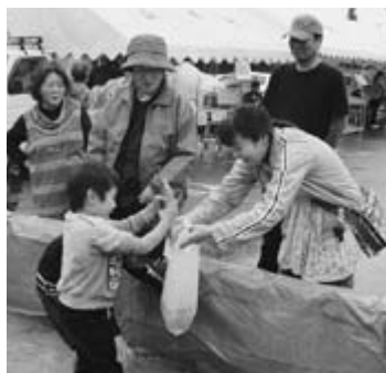
▲興奮、魚のつかみ取り