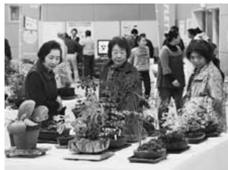
▲すばらしい作品が並びました