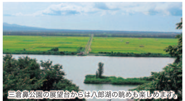
三倉鼻公園の展望台からは八郎湖の眺めも楽しめます。