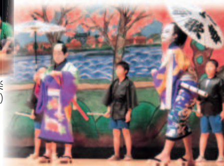
森岳子ども歌舞伎