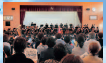
総勢80名のフルオーケストラ