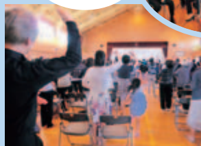
皆でボディーパーカッション！