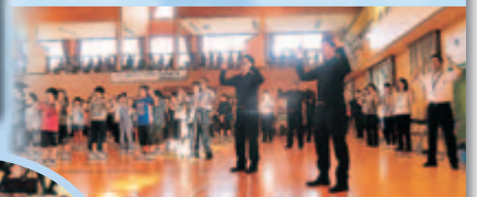
湖北小学校も頑張ります