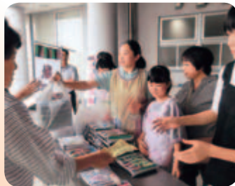
森岳小児童による歌舞伎弁当の販売