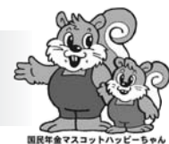
国民年金マスコットハッピーちゃん

国民年金受給予定者を対象にした相談を年金窓口で行っています。お気軽にご相談ください。