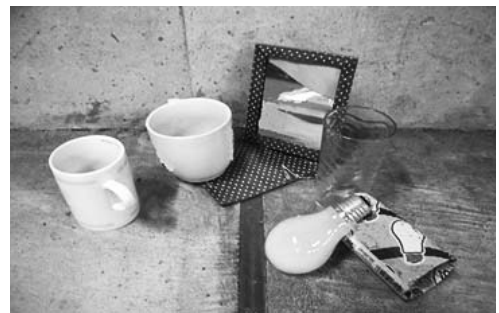
資源ごみとならないものの例

割れたビンは危なくないように新聞紙等で包んで、一緒に「燃えないごみ」に出してください。