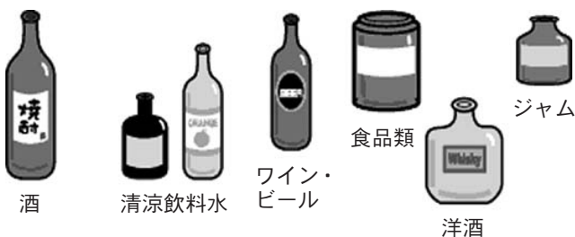
資源ごみとなる対象例

ジュース、酒類、コーヒー、ジャム、口に入る薬品などが「資源ごみ」の対象です。牛乳ビン、ビールビン、一升瓶はなるべく酒屋さんなどの販売店に引き取ってもらってください。ラムネのように、道具を使用しないとキャップがはずせないものは、無理せずそのまま「資源ごみ」に出してください。