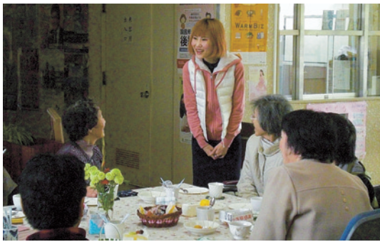
サロン来場者に自己紹介をしています。