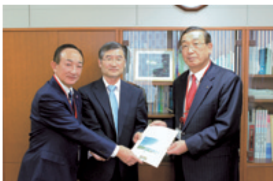
環境省 東北地方環境事務所長