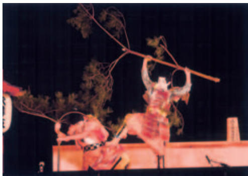
撮影地 森岳 (森岳歌舞伎)