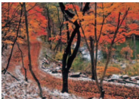
撮影地 石倉山公園