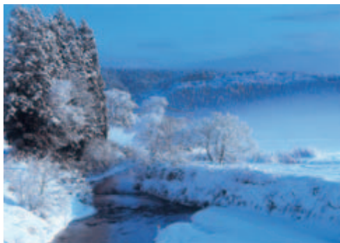
撮影地 上岩川落合